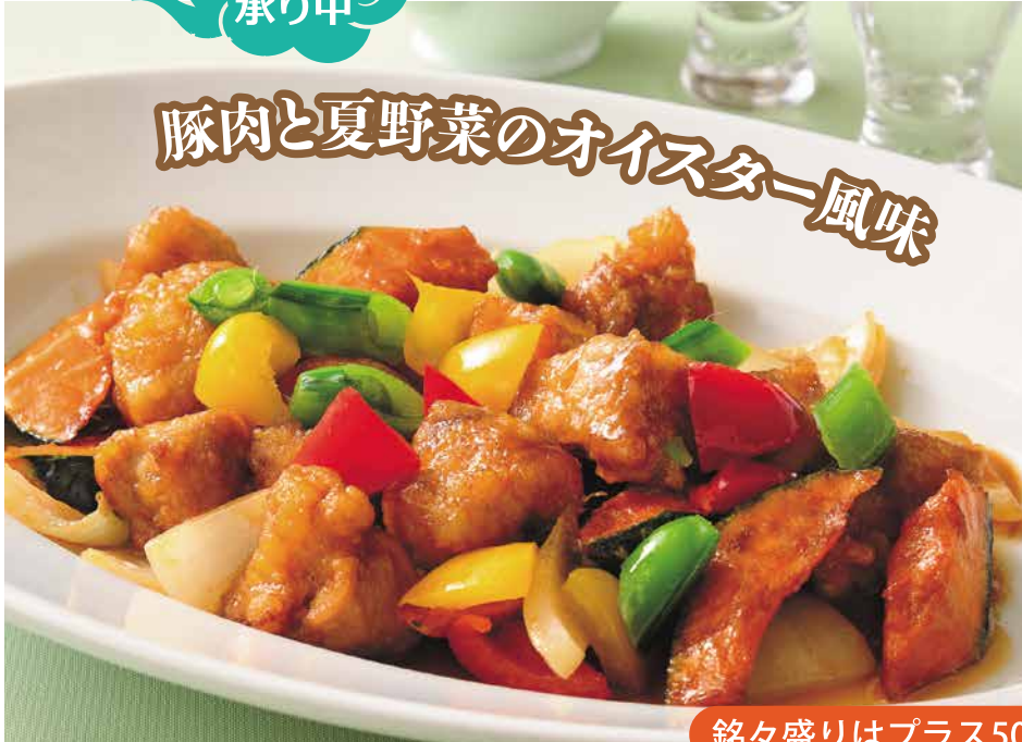
豚肉と夏野菜のオイスター風味